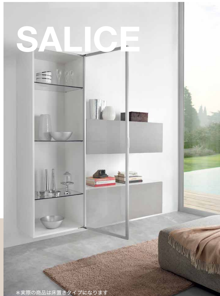
*実際の商品は床置きタイプになります

ディスプレイ家具で採用される大型ガラス扉の場合、扉丁番が目立つことでデザイン性を損なうデメリットがありましたが、AIRヒンジは丁番を完全に隠すことができるので、細部まで拘ったデザインを提案することが可能です。